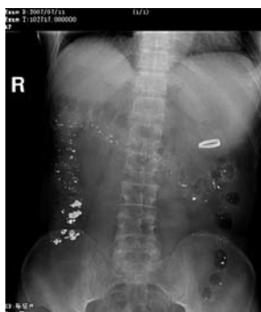
图 2 术后3 d腹部平片显示CAC在胃空肠吻合口处.

保留在吻合的胃肠段(图1).然后用弯止血钳尖确定开孔口,并适当扩大之.胃残端、空肠祥上的5 mm切口用3-0可吸收线全层内翻缝合,再加浆肌层包埋,剪掉固定线.