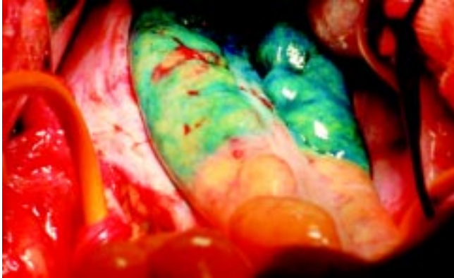
图1 直肠及其系膜与周围组织分界明显

膜不染色(图2),仔细分离至直肠两侧下部时可见白色的神经丛.分离侧韧带时,也可见直肠筋膜囊内染蓝色,与筋膜囊外不染色的组织区分明显,在侧韧带根部剪断之,只需压迫或一次结扎直肠下动脉止血.检查切除的标本,见直肠筋膜囊完整,系膜内的淋巴结为美蓝染成蓝色,与周围脂肪组织区分明显,便于检查(图3).