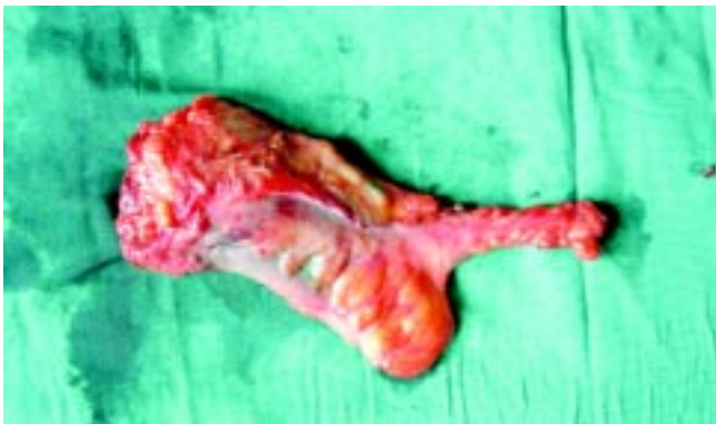
图3 切除的标本上直肠筋膜囊完整,淋巴结蓝染

2.2 灌注组的手术时间和失血量均较不灌注组明显减少,术后标本淋巴结检出数目增加(表2)。